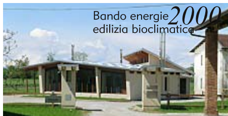
Bando energie 2000 edilizia bioclimatica

Clinica Veterinaria Mattalia Margarita (CN). NUOVA COSTRUZIONE Comm. Privata – 300 mq Progetto 1998, realizzazione 2000-2002 progettazione urbanistica, architettonica e strutture, bilancio energetico