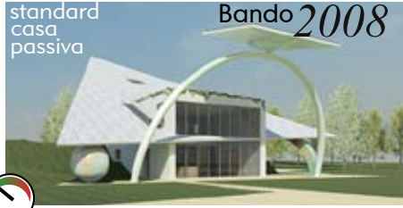
standard casa passiva Bando 2008

Edificio per uffici SASIL SpA Brusnengo (BI). NUOVA COSTRUZIONE Comm. Privata – 340 mq Progetto 2008, realizzazione 2011 prog. architettonico, bilancio energetico, impianto termico e sistemi solari.