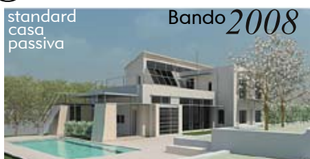
standard casa passiva Bando 2008

Abitazione privata – Casa Passiva® Cuneo. NUOVA COSTRUZIONE Comm. Privata – 300 mq Progetto 2008, realizzazione 2010-2011 prog. architettonico, bilancio energetico, impianto termico e sistemi solari.